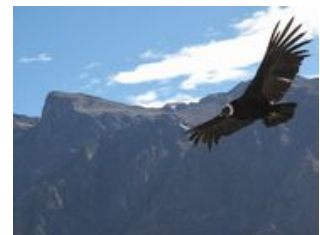
Les repas inclus : petit déjeuner, dîner

Attention, il fait froid la nuit (surtout en hiver, de mai à septembre), il est donc recommandé d'apporter un sac de couchage pour les participants frileux.