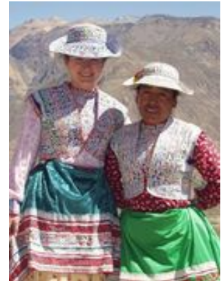
Les repas inclus : petit déjeuner, déjeuner